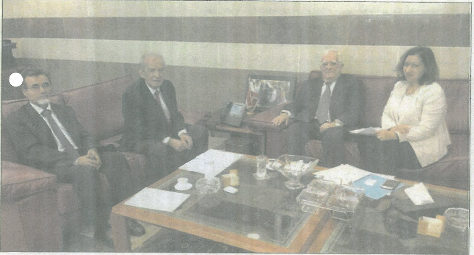
وزير التربية مستقبلا القصار